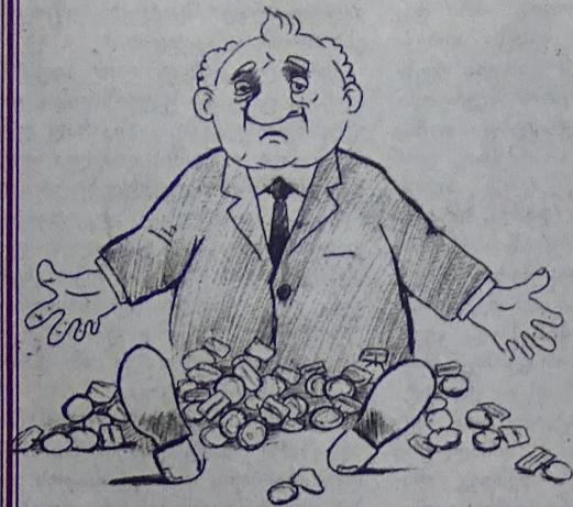
ამ ხალხს ღირსება მართლა ჰქონია...