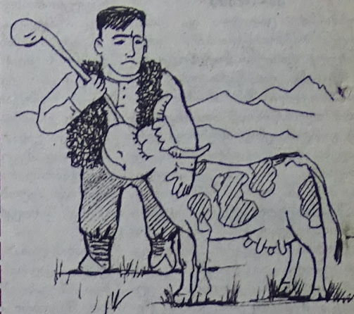
მიხეილ სააკაშვილი („კვირის პალიტრა“): პენიტენციული სისტემა მეწველი ძროხა არ არის.