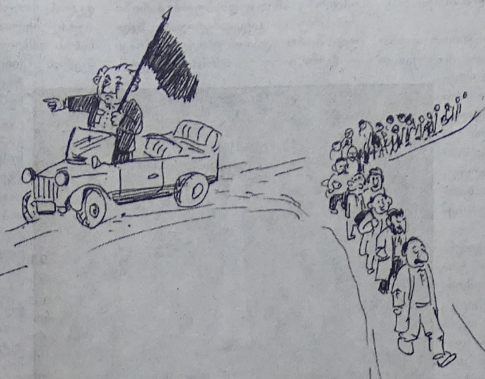
გოდამიძე ჩოხელი („ახალი თაობა“): ჩვენი პრეზიდენტი ყვარყვარეს როლს ძალიან მოუხდებოდა... დროშა შენახული აქვს, როცა უნდა, მაშინ ააფრიალებს...